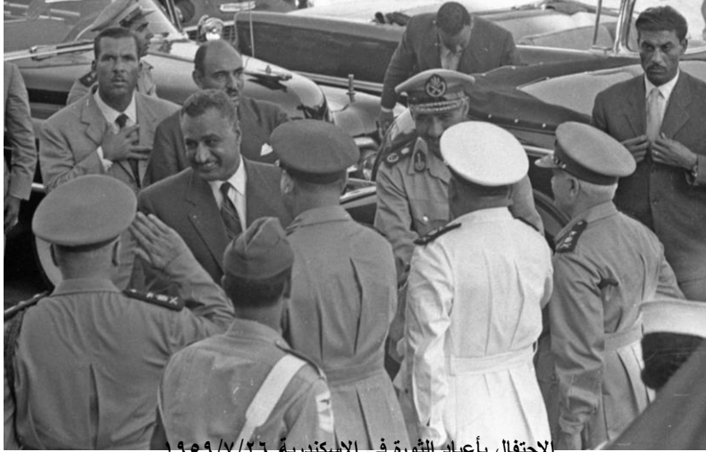
الاحتفال بأعياد الثورة فى الإسكندرية ٢٦/٧/١٩٥٩