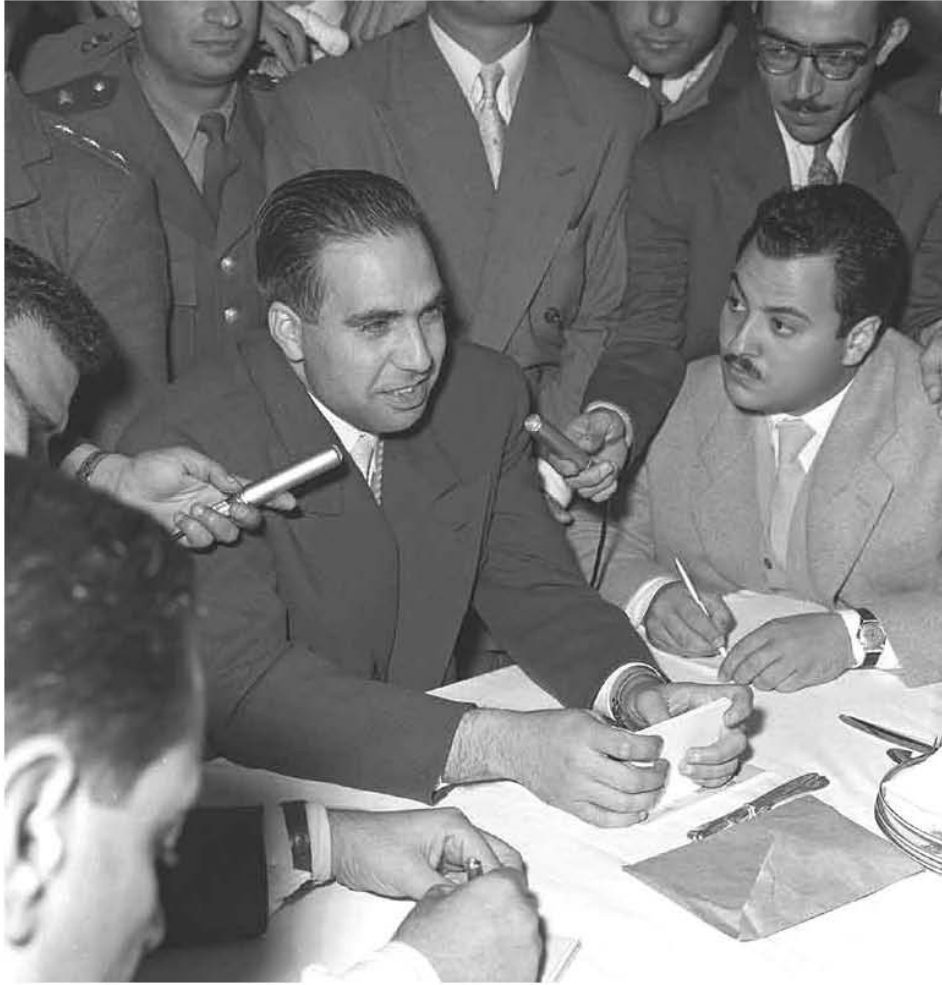
عبد الحميد السراج يكشف عن المؤامرة السعودية لإفشال الوحدة المصرية السورية ١٩٥٨/٣/٥