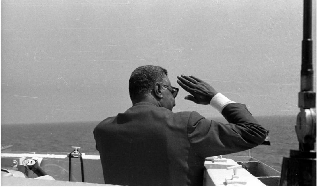
الرئيس يشهد عرض القوات البحرية فى عيد الثورة بالإسكندرية ١٩٥٩/٧/٢٧