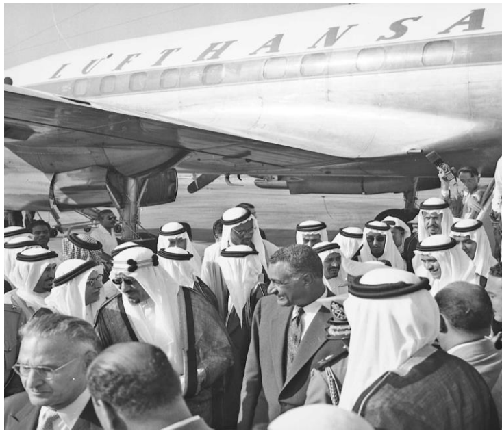
استقبال الملك سعود ومرافقوه ١٩٥٩/٨/٩